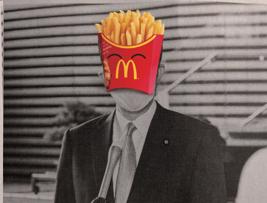
記者団の質問に答える塾長(?) = 16日 首相官邸(?)

「大人だけズルいよ。僕たち子供だって毎日我慢してるんだ。今は、何をやってても家で怒られる。パパやママは何だかとてもイライラしているみたい。大人は国から何か一杯お金がもらえるみたいだけど、僕たちには何もないの？」こんな声が届いた。塾長は、こうした子供たちの声を受け、独自に決断した模様。